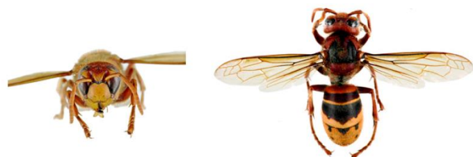
Frelon d'Europe, Vespa crabro