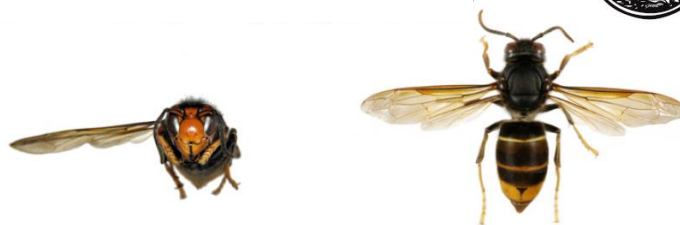
Frelon asiatique à pattes jaunes, Vespa velutina var. nigrithorax

Le frelon d'Europe , Vespa crabro , a l'abdomen à dominante jaune clair , avec des bandes noires. Sa tête est jaune de face et rouge au dessus. Son thorax et ses pattes sont noirs et brun-rouges . Les ouvrières mesurent entre 18 et 23mm et les reines entre 25 et 35.