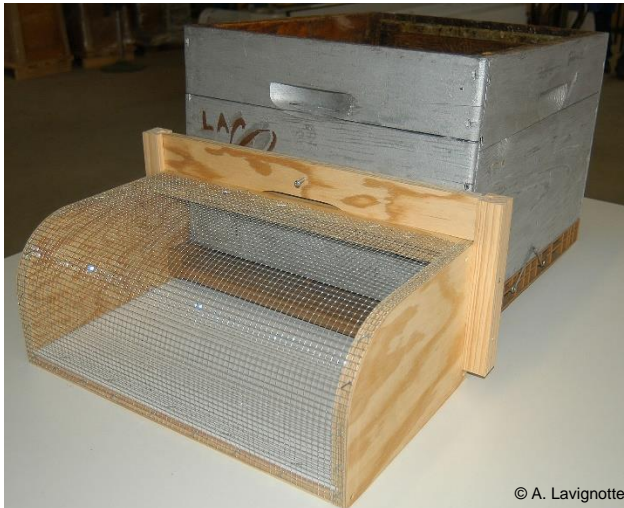
Trou de vol protégé par une grille

Il est déconseillé de poser des pièges. Ceux-ci ne sont pas assez efficaces, ni sélectifs.